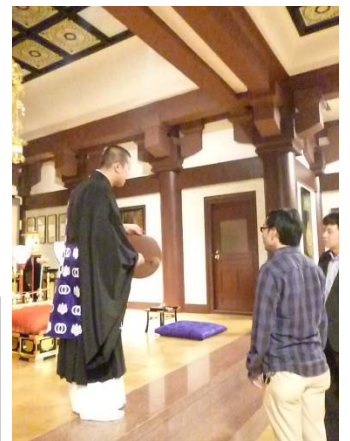
お寺に興味のある人、ない人、年齢も国籍もさまざまな人が集まって、新しい交流が生まれました。