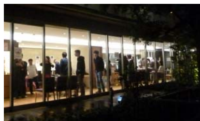
おいしいお料理と飲み物を片手に、夜更けまでパーティは続きました。

★最近街を歩いていて、「意外に外国の方がたくさん住んでいるなあ」と感じていました。そんな方々 にお寺に足を運んでいただくきっかけになれば、と 初チャレンジしたのが今回のイベントです。こうした イベントを通じてご縁が国境を越えて繋がり、広が っていくと素敵ですね。 (住職記)