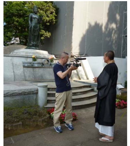
永代供養墓前での撮影風景