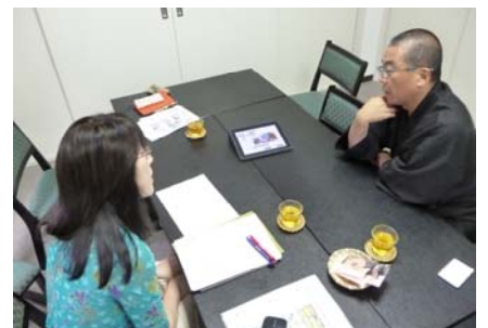
日々進化する情報技術を取り入れて・

テムなど新しい試みが色々できます。お寺の歴史や情報をお伝えすることはもちろんエンターテインメント性もある AR。「活用しながら保存する」新しいお寺の可能性が広がりそうです。