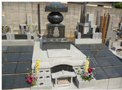
集合墓地の新しい形として作られた、「やすらぎ五輪塔」も撮影されました

今回の企画は「お墓について真剣に考えている方の疑問や悩みに応える情報提供」とのこと。「終活」に対する関心の高さを改めて感じた取材でした。