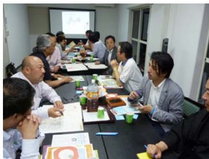
町の魅力を再発見するところから開始

イベントやお祭りで中心的な役割を担っていらっしゃる地元の皆さんや、地域活性化を支援する方々などが集合。この日は椎名町の未来構想について「ワールド・カフェ」というスタイルで語る座談会です。コーディネーターの上手なリードで、終始リラックスした雰囲気の中、活発な議論が行なわれました。