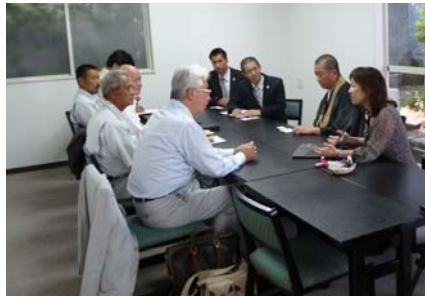
これからの葬儀について活発な意見交換が行なわれました

さまざまな葬儀の形のなかで、お寺発の「お別れのとき」を提案し、遺族の思いに応える準備などについて、これからも話し合っ