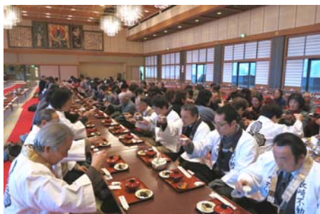
光輪閣での坊入り。御神酒で新年の乾杯