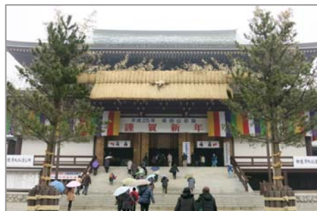
朝方の小雨もお昼過ぎには上がりました