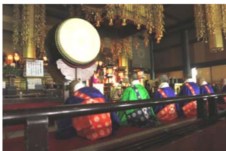
1年の幸せを祈り大護摩を授けました

この日、一行は成田山登山 のあと、非公開の浅草寺庭 園見学、スカイツリー展望 台からの絶景を堪能と盛りだくさん の1日を過ごし交流を深めました。