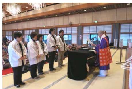
新しい講員さん5名の任命書伝達式