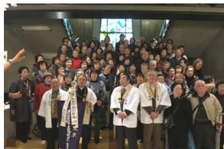
今回は総勢91名が参加しました