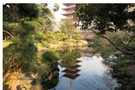
浅草寺特別拝観（右）にスカイツリー展望台と充実の1日に