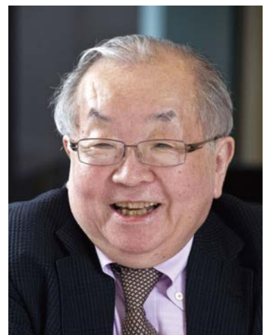
帯津良一先生プロフィール

医学博士。帯津三敬病院名誉院長。日本ホリスティック医学協会会長。東京大学医学部第三外科、都立駒込病院勤務を経て1982年埼玉県川越市に帯津三敬病院を設立。医療の東西融合という新機軸を基に、ガン患者などの治療に当たっている。