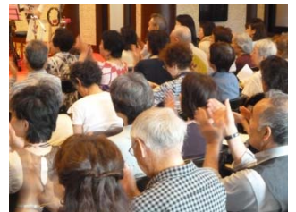
懐かしい映画音楽やシャンソンに、会場はうっとり。大きな拍手が鳴り止みませんでした。