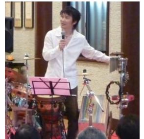
軽快な祝典賛歌「ジョイフル・ジョイフル」で幕を開けたステージ。3人の息もピッタリです！