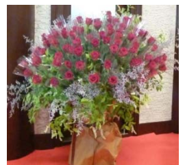
「ふるさと」合唱の後、感謝の花束贈呈。舞台を飾ったバラは参加者にプレゼントされました。