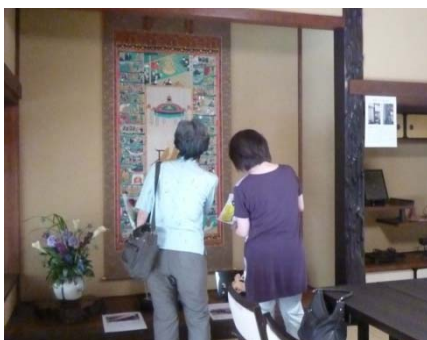
コンサート後には、文化財になった庫裏の説明を熱心にご覧になる方の姿も見られました。

★お寺にご縁のある方々をお招きして、久しぶりに本堂で開いたコンサート。今回はバリアフリー化で車椅子の方もお迎えすることができました。舞台を見守るご本尊様も、素敵な音楽と、皆さんの笑顔喜んでおられたようです。今後もこうした「ご縁を結ぶ催し」を広げていきたいですね。(住職記)